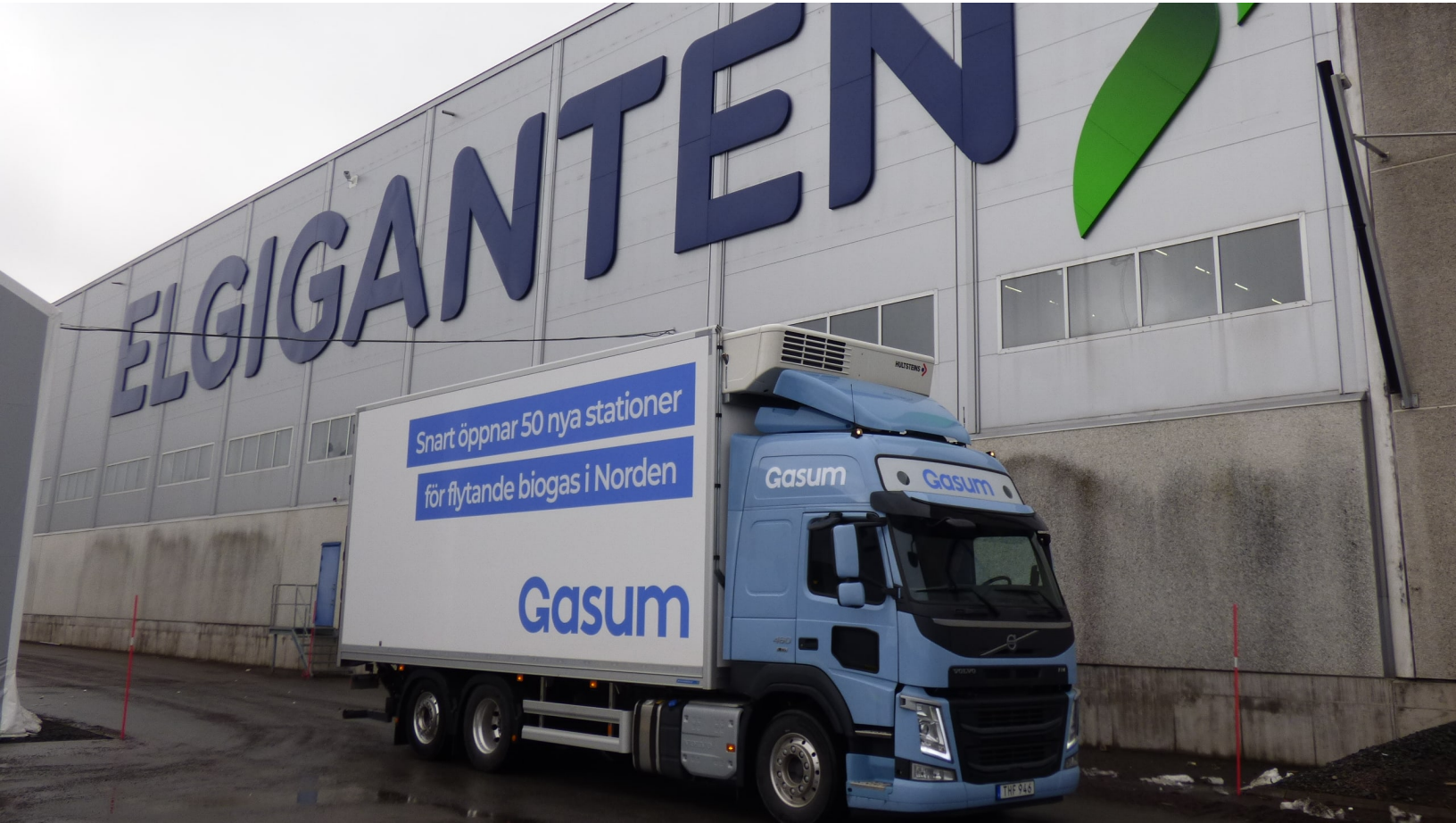
En av Gasums gassdrevne Volvo-lastebiler foran Elkjøps nordiske distribusjonssenter i Sverige